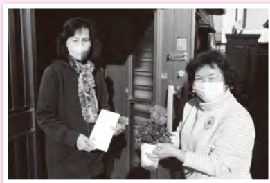
高齢者宅への訪問の様子