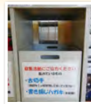
可児市福祉センターにある 収集ボックス