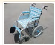
整理した切手で購入した車いす。 当社協の福祉用具貸出事業で活用されています。