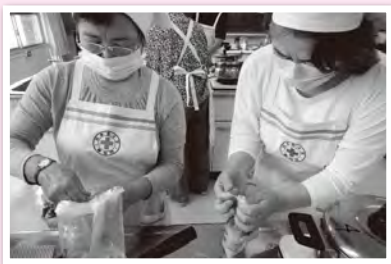
炊き出し訓練の様子

赤十字の活動を支える、地域のボランティアが赤十字奉仕団です。 可児市では、昭和54年に可児市赤十字奉仕団が創設されました。市内を12で分けた分団で構成され、現在194名の団員が活動をしています。 普段の活動は、災害時に備えた炊き出し訓練、高齢者宅への訪問などの活動を行っています。