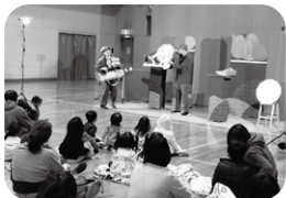
▲ 土田地区 (人形劇公演会)