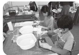
▲ 福祉ドキドキ・わくわく体験 (被災写真洗浄ボランティア)