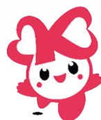
イメージキャラクター 「こころん」