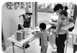
▲ 子ども食堂 (かこっ子食堂)

地域の身近な居場所づくりの活動である「ふれあい・いきいきサロン」に関する相談、運営費の助成、研修会の開催などの支援をしています。