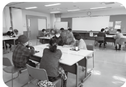
▲ 広見東地区 (おしゃべりサロン東縁)

皆さまからいただいた会費の一部を各地区社会福祉協議会の活動費として助成しています。