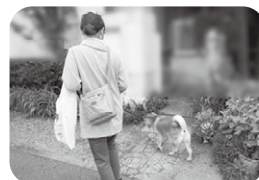
▲ 犬の散歩ボランティア