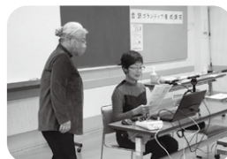
▲ 音訳ボランティア養成講座

ボランティア活動の紹介や調整、保険加入の受付など活動全般の相談に応じています。また、ボランティア講座を開催し、活動者の育成を行っています。