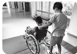
▲ 南帷子小 (車いす体験)

夏休みに小学生の高学年を対象に、福祉に関する講座として「福祉ドキドキ・わくわく体験」を開催しています。