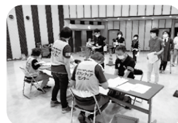
▲ 災害ボランティアセンター 設置運営訓練

地震や豪雨などの災害に備え、「災害ボランティアセンター」の設置訓練や市民向けの講座を開催し、災害に備えた体制整備や活動者の育成を行っています。