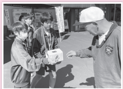
パレマルシェ西可児店