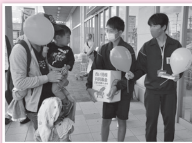
スーパーセンターオークワ 可児御嵩インター店