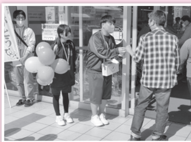
スーパーセンターオークワ 可児坂戸店