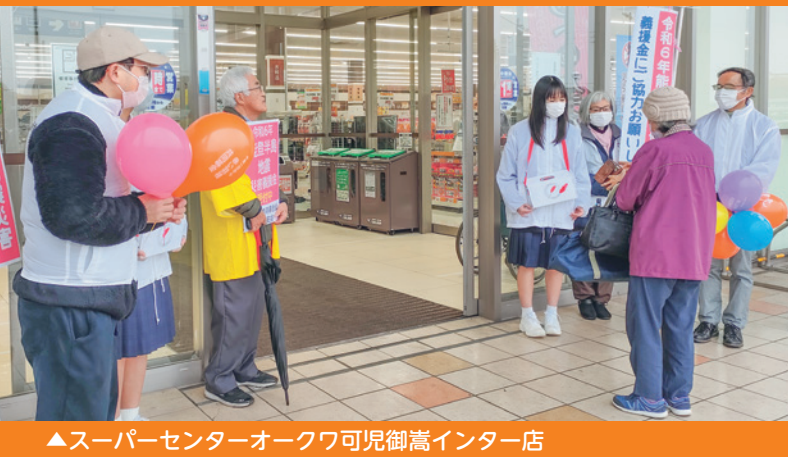
▲スーパーセンターオークワ可児御嵩インター店