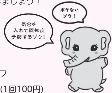
▲岐阜医療科学大学 なないろルームで作成