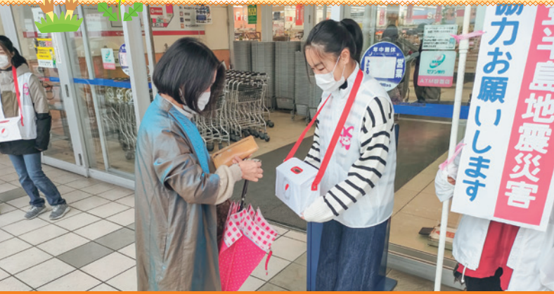
▲スーパーセンターオークワ可児坂戸店